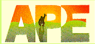
Asociación Primatológica Española

El programa de Formación de MONA cuenta con el apoyo de: